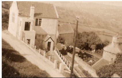
Modifications d' églises Modifications des édifices religieux du centre et des hameaux