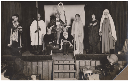
Divertissement S'amuser dans les années 1920 et 1930, y compris le Hazelbury Pageant