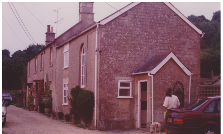
Église de la chapelle méthodiste

Les personnes incroyables impliquées dans la gestion de la chapelle