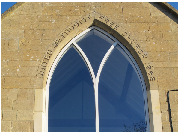
United Methodist Church, Box Hill

Les personnes incroyables impliquées dans la gestion de la chapelle