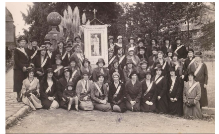
Rôle des femmes Ce que les femmes ont réalisé - et n'ont pas été autorisées à influencer